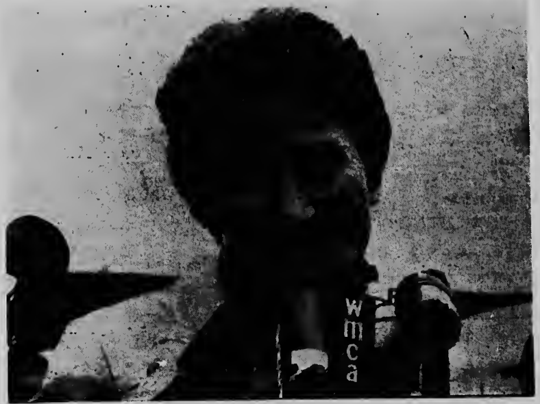
Svetlana Stalin, e jiu muher di e difuntu dictador Josef Stalin na su yegada na New York siman pasá a hasi un declaracion corticu pa prensa mientras cu tambe el a declara cu durante su permanencia na Merca, lo e supervisá un boeki riba su tata.